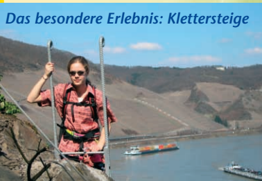
Das besondere Erlebnis: Klettersteige